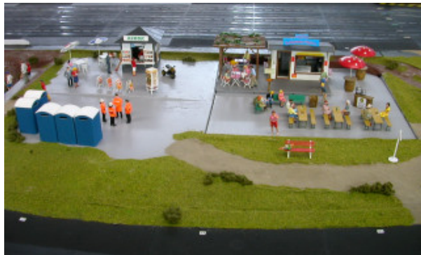
Rennatmosphäre bei ScaRaDo . . .

Aber da gebe ich doch zu bedenken - gibt der BVB so schnell auf - kristallisiert sich da nicht in neuer Spitzenfahrer bei euch heraus, den ihr gemeinschaftlich aufbauen könnt ?!!