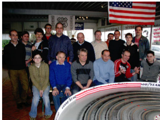
...Potential der möglichen Teilnehmer an einem Rennabend !!

Trainingseinheiten verzichten. Damit alles unkompliziert bleibt, wird die Organisation auf viele Beine gestellt. Wobei die Jungs des SRC DU-Mündelheim wahre Könner auf dem Gebiet der Rennabend-Organisation sind. Schon früh im Jahr wurden acht der jetzt ausgewählten Termine freigehalten, um mit den Trucks auf verschiedenen Bahnen wieder aufzutauchen. Aber leider hatte es viel zu lange gedauert, bis der Leidensdruck ausreichend groß war, wieder Craftsman Truck zu fahren.