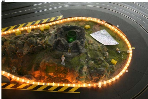
Nordkehre mit Schummer-Licht

Kurzentschlossene sind immer gerne gesehen, und werden auch ebenso freundlich empfangen.