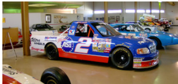
...da stehen sie schon im Museum !!

... treffen wir uns erstmalig wieder in den Clubräumen des SRC DU-Süd in Mündelheim am Mittwoch, den 10.09.2008. In der Hoffnung, dass nicht zu viele Ihre Fahrzeuge leichtfertig geschlachtet haben, würden wir uns über grob geschätzt 12 Starter sehr freuen. Damit der Wiedereinstieg problemlos ohne Zusatzkosten möglich ist, haben wir den Reifenmindestdurchmesser auf der Hinterhand 2008 auf 26 mm reduziert.