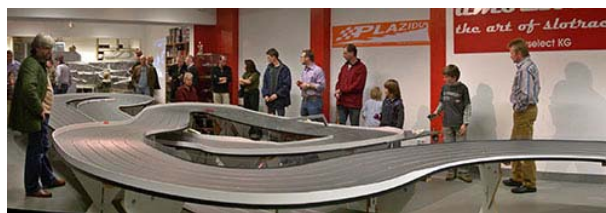
.... amoslot – the art of slotracing

Nach dem großen Erfolg der ersten Halbzeit der Duessel-Village 250 starten wir nun offiziell in die zweite Jahreshälfte mit erneut 4 Läufen. Der 5te Lauf wird auf der bekannten Laguna Negra im Slotracing-Center amoslot ausgetragen.