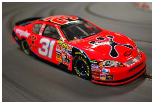
...Fahrzeug des neuen Teams MRT..!

Für diesen Event haben bereits neue Teilnehmer gemeldet, welche wir bisher als Gaststarter begrüßen konnten.