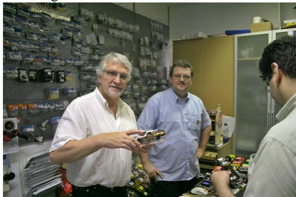
... Fahrzeuge werden zur Abnahme getrennt vorgestellt..!

Die Rennen werden im Anschluss statt finden und in 4er/bzw. 5er Gruppen gefahren. Die Startaufstellung des ersten Stints wird bestimmt durch die Gesamtrangliste der bisherigen Läufe.