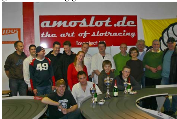
... Slotracing Marathon

Auch gibt es im Renncenter einige Sonderveranstaltungen, welche auch über die Landesgrenzen hinaus für Begeisterung sorgen, wie z.B. der bekannte Slotracing Marathon zu dem selbst Gäste aus den Niederlanden, Belgien oder Frankreich anreisen. Ebenso kann die Rennstrecke für besondere Veranstaltungen inkl. Catering gemietet werden.