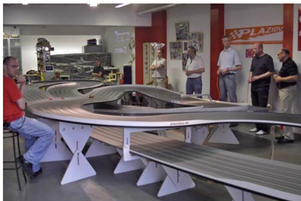
... 44 Meter Plazidus..!