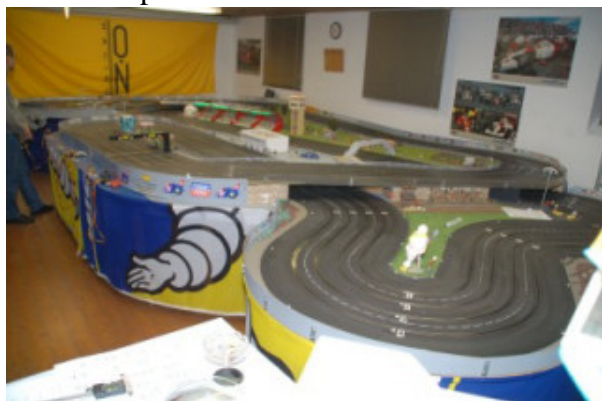
... Carrera Track in DU – Mündelheim !!

... in WW 163 hatte ich bereits angekündigt, dass die beliebte Feierabend Serie der NASCAR's in der zweiten Jahreshälfte 2008 mit 4 Rennläufen weitergeführt wird. Vorläufig beschränken wir uns nur auf die NASCAR Trucks und fahren diese nicht in Kombination mit V8 Trans-Am. Dafür wird aber jeder Rennabend mit einem Qualifying eingeleitet. Grund ist, dass immer die Tagesbesten miteinander kämpfen sollten.