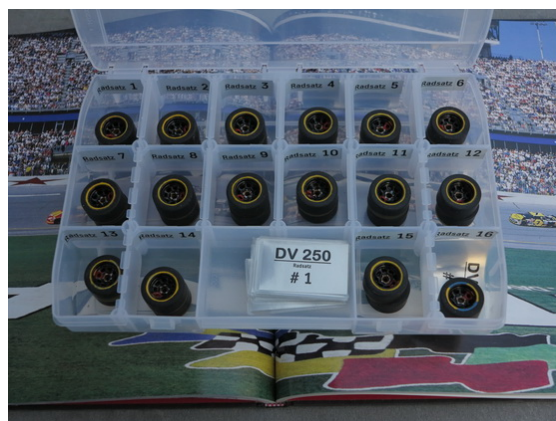
Duessel-Village PU-Ausgaberäder für drei Rennen der Saison 2017...

Gruß und bleibt immer im Slot Frieder + Ingo