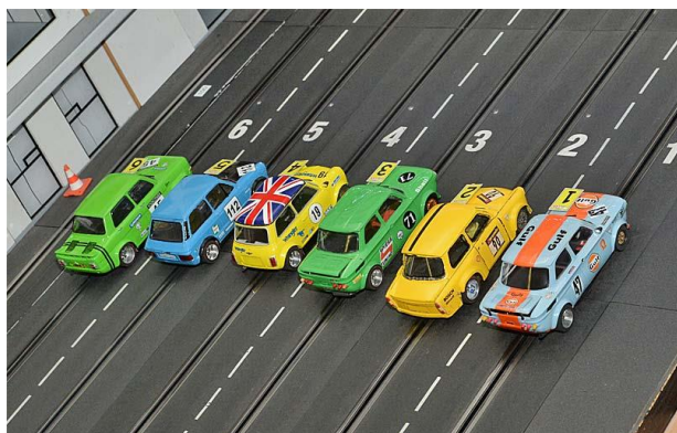
Vor dem Start . . .