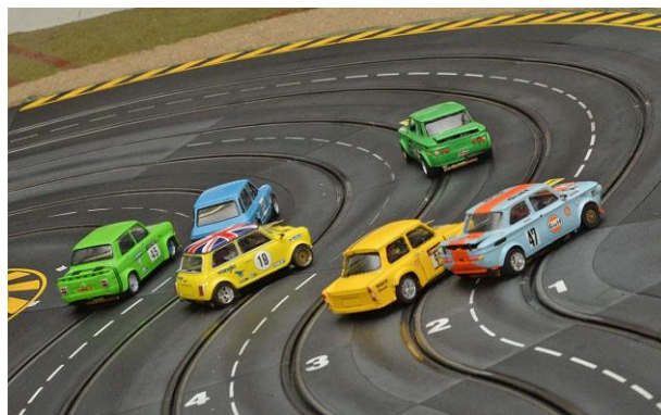
Mit viel „Hüftschwung“ ...