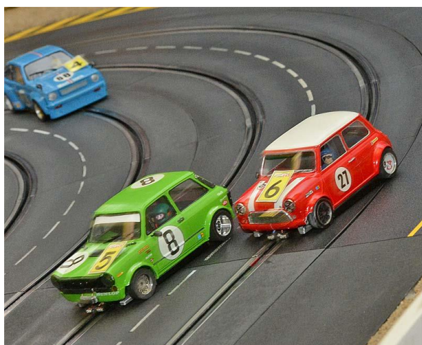
Das Duell an der Spitze in 2017 . . .

Alles zur Gruppe 245 Rennserien-West / Gruppe 245