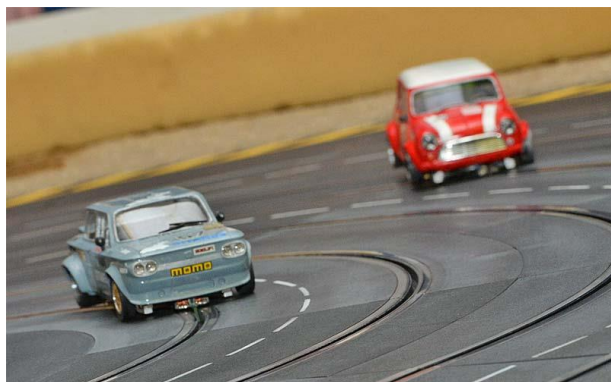
Stuntshow der Klein(st)en ...

„Zwergenaufstand“ am 03.02.2018 in Dortmund