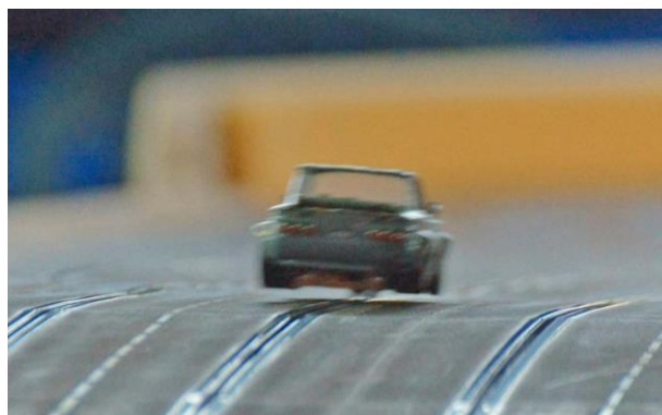
„Beinchen in die Höh“ ...