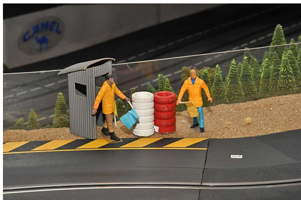
Die ScaRaDo-Posten hatten ein Jahr Zeit, sich vom Stress-Job in 2018 zu erholen . . .