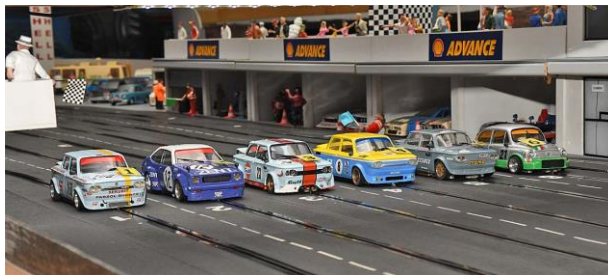
Vor dem Start . . .