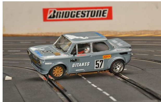
...nicht alle Stunts gehen gut!?