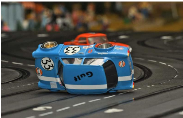
Stuntshow der Klein(st)en...

„Zwergenaufstand“ am 09.02.2019 in Dortmund