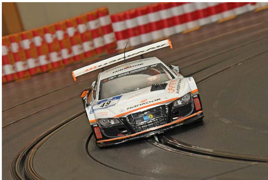
Und noch’n R8 – zumindest südlich von Köln scheint’n Nest davon zu sein . . . !?

deten Vorwiderstände auf den Zahn gefühlt werden. Gemeckert wurde nicht die Spur – also wird’s ok gewesen sein! 😊