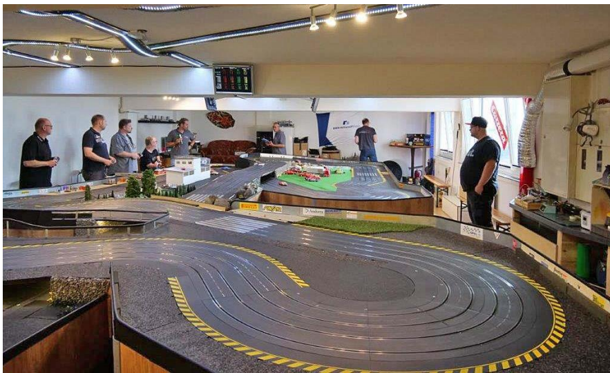
Überblick über den Kurs in Wermelskirchen...

Der für die heutige Ausgabe geplante Bericht vom NASCAR Grand National bei Dellmann in Wermelskirchen wird zu einem späteren Zeitpunkt nachgeliefert . . .