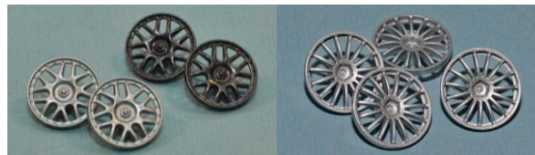
SC7610 "BBS Racing" (alte Ausführung)

4 Stück der folgenden Typen von Felgeneinsätzen müssen am Fahrzeug montiert sein (Ausnahme: Materialausgabe der Hinterräder):