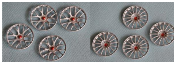
SC7610 "BBS Racing"

Die Bearbeitung der Felgeneinsätze ist zur Erzielung einer angemessenen Passform zulässig. Maßnahmen, die ausschließlich/ überwiegend der Gewichts-erleichterung dienen, sind nicht erlaubt. 7)