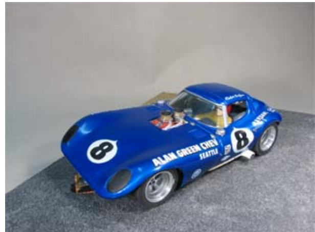
Knapp geschlagen - Cheetah Coupé von Thomas Gellenbeck . . .

Auch Thomas Gellenbeck mischte in diesem Fight lange Zeit mit und lag am Ende mit dem Cheetah Coupé und 223,40 Runden nur knapp zurück.