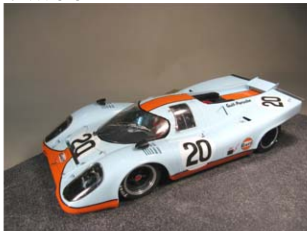
Sieger-/Sommerwagen - Porsche 917K von Dieter Sommer . . .

JanS hielt mit „nur“ 233,42 Runden auf dem 906 die Spannung in der Gesamtwertung bis zum Finale offen und des Schleichenden King Cobra beendete die Aufholjagd auf „Light-blue“ Fischer nur 17 Teilstriche hinter dem GT40 aus Wuppertal (235,39 vs. 235,22 Runden) - wäre man doch nur 30,5 Minuten gefahren . . . ☺ ☺