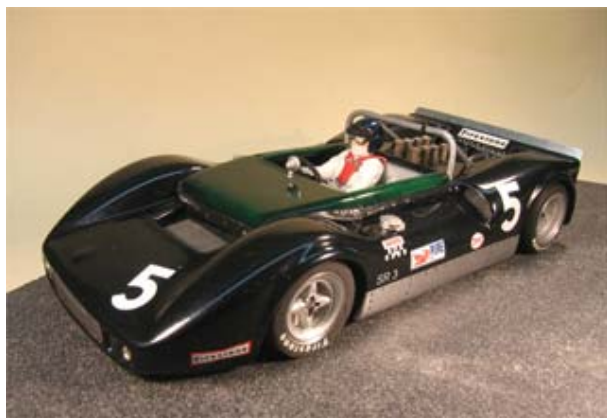
Läuft auf Holz und auf Plastik - Matich SR3 von Uli Hütwohl . . .

Dr.Evermann fuhr sich bereits beim Lauf zur Vintage Anfang September auf dem ScaRaDo Kurs ein. Welche Fahrzeuge aus seinem reichhaltigen Fuhrpark zum Einsatz kommen - wer weiß !? Der Schleichende tippt auf „Cheetah“ und 917K . . . ☺ ☺