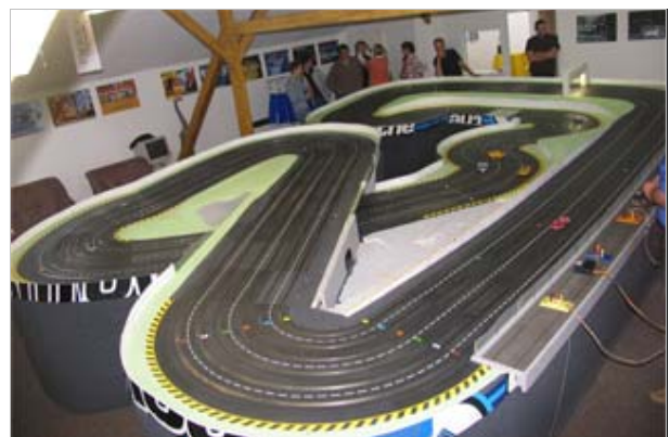
Strecke für den Auftakt - 28m Neuwerk pur . . .

Traditionell werden beim ersten Rennen der Saison eine Menge neuer Slotcars erwartet. Da heißt es wieder Überstunden bei der Concours Wertung schieben. Deshalb jetzt schon die Bitte an alle Teilnehmer, die Fahrzeuge vielleicht schon am Freitag vor dem Rennen abnehmen zu lassen !!