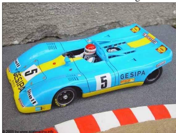
Beim letzten Cup-Lauf in Heroldsberg auf P3 - Porsche 917 PA von Peter Berg . . .

Werfen wir noch kurz einen Blick auf den Stand der Dinge in DSC-Mitte und DSC-Cup, welche beide in Siegen ihre Champions für das Jahr 2005 küren: