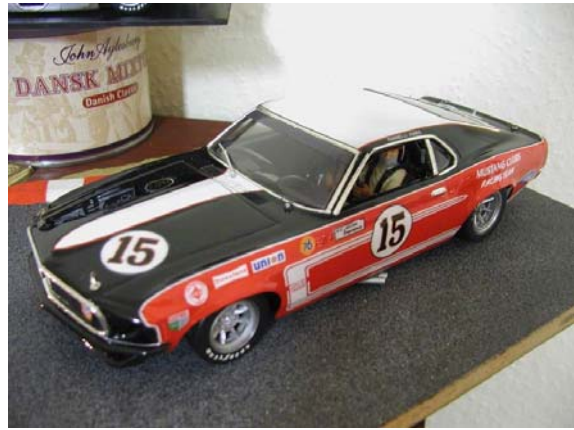
69er Mustang Kit von Wiesel - auch eine Art Jubiläum, aber des Vorbildes; was also kocht „Methusalem“ für Siegen aus . . . !?

Darüber hinaus sind selbstredend jede Menge anderer Resine-Kits sowie ausreichende Mengen des schwarzen Goldes am Mann, wenn der Hochseedampfer aus NMS einrollt . . .