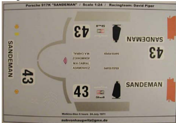
Decals für den grünen "Sandeman" 917K aus dem Werk . . .

Wirklich brandneu wird jedoch ein Porsche 917 „Sandeman“ Decalbogen in der grünen Variante sein . . . !! Und dazu kommen zwei Lexan-Fahrereinsätze für die 53er Corvette, den Jaguar D (XK SS) sowie für den MB 300 SLR zu welchen separate Arme und Köpfe benötigt werden . . .