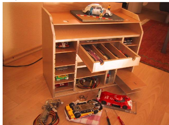
„Der Mann mit dem Koffer“ kommt natürlich auch - Team AliFumi zeigt, was die Domäne der ostwestfälischen Industrie ist . . .

„Der TeamFumi Shop kommt natürlich auch, gefüllt mit großen und kleinen Fumi-Boxen sofort zum Mitnehmen.“