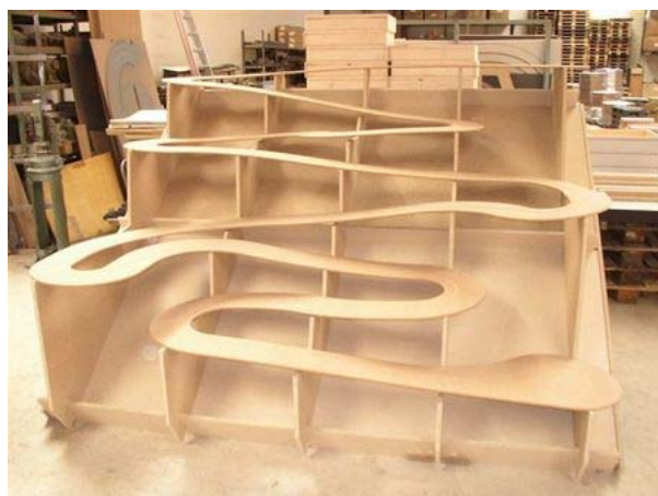
Single Wooden Track in der Fertigung . . .

Parkmöglichkeiten gibt es direkt gegenüber (alter Güterbahnhof). Für das leibliche Wohl wird gesorgt.