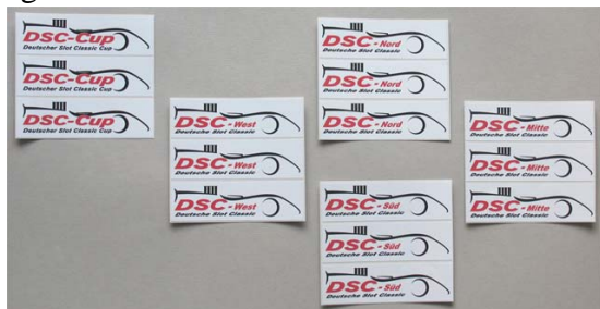
DSC-Cup - Fortsetzung der Merchandising Offensive u.a. mit Aufklebern . . .

Wie aus gewöhnlich gut unterrichteten Kreisen verlautete, kommen pünktlich zum Rennen in Siegen evtl. weitere Artikel ins Sortiment . . .