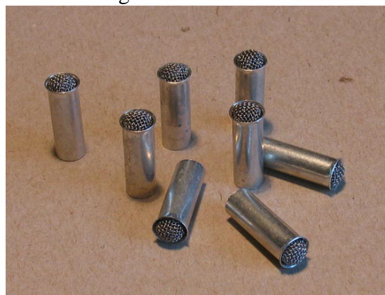
Fischer Modellbau - u.a. neu: Ansaugtrichter mit feinem Gitternetz . . .