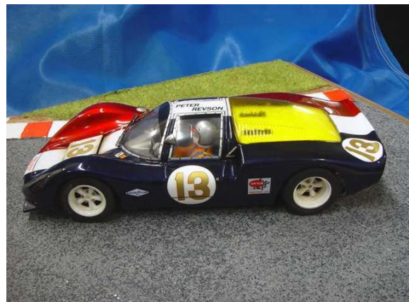
Auch bei slotvision gibt's noch kein Foto von der „Sinus“ Platte - dafür aber ein Foto von einem bemerkenswerten Porsche 906 . . .

Bei Thomas Spicker gibt es in Bezug auf Bodels nichts Neues, hierfür fehlt ihm im Moment etwas die Zeit . . .