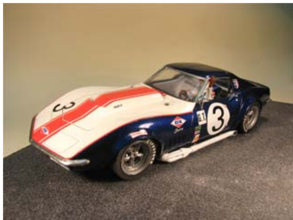
Der erste Champ der DSC-West - Chevrolet Corvette '68 von Dieter Sommer . . .