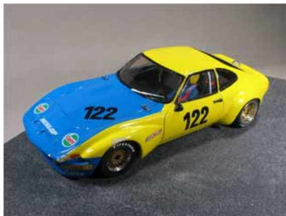
Im Juli in Siegen mit Problemen unterwegs - Opel GT von Uli Hütwohl . . .