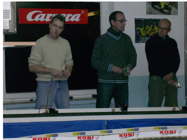
Drei beim Rennen - nur bei einem loderte das Feuer des Siegers in den Augen ...