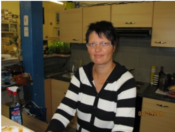
Die Chefs vom Ganzen

Bilder der Veranstaltung können hier Abgerufen werden: