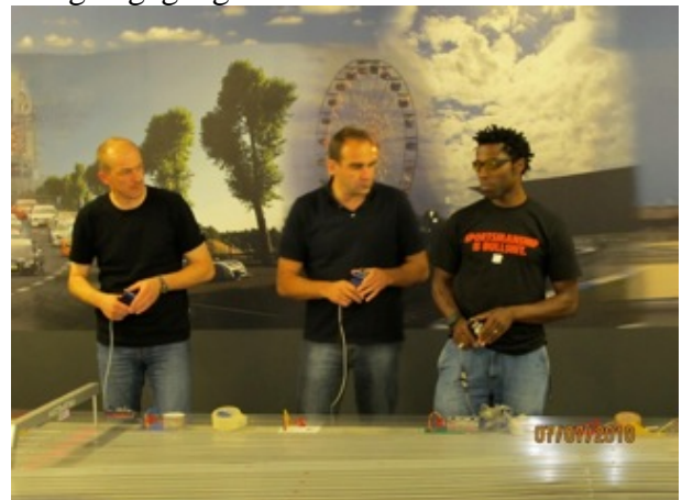
Süd trifft Nord im Westen

Der Berichterstatter selber verließ das Renn-center gegen 1:30 Uhr – Gerüchten zufolge soll es aber noch deutlich bis in den Samstag-morgen gegangen sein.