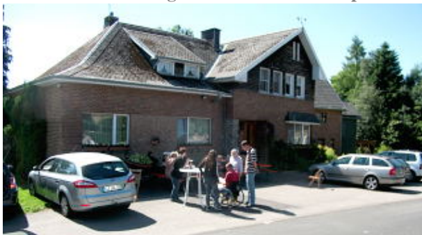
...der Standort in Elsenborn !!