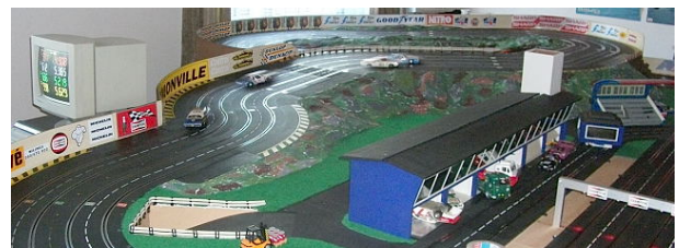
...die Busstop mit vier Trainingsboliden !!

4-spurige, Carrera-Bahn ca. 16 m lang nach dem Vorbild Rocherath bei Walter Schäfer in Elsenborn (B) 674m + 694m