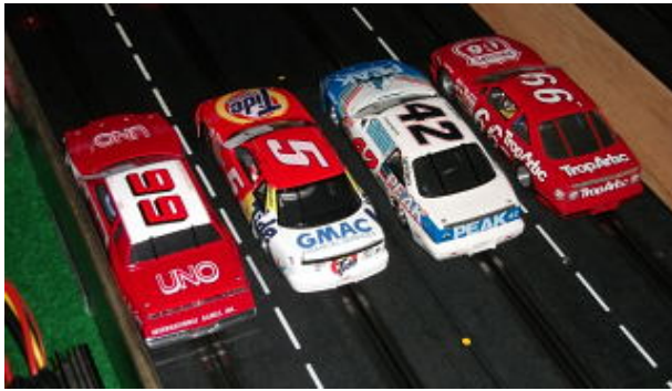
...Startgruppe 1 zum Heat 1 !!

nen Höllenspaß, solange das Feld eng zusammen bleibt.