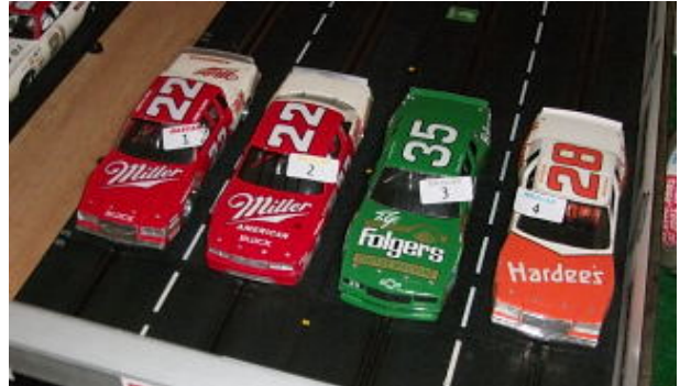
...Startgruppe 3 zum Heat 1 !!