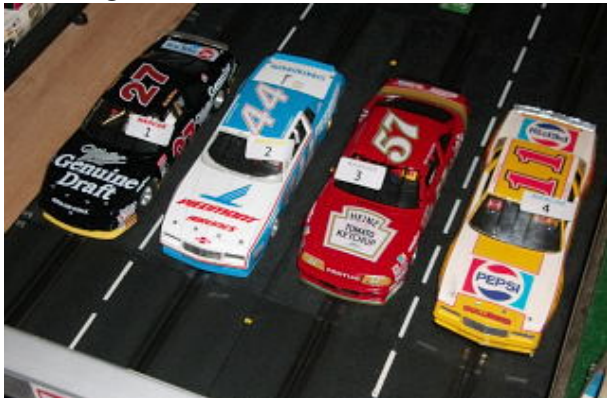
...Startgruppe 2 zum Heat 1 !!

...danach durfte endlich der Gastgeber Walter ins Geschehen eingreifen. Die ersten beiden Spuren wurden mit je 50 Rd. absolviert, sodass die Hoffnung auf ein Ergebnis mit über 200 Rd. in Gedanken möglich war. Aber kleine unverschuldete Ausritte ließen die Hoffnung schwinden und bei 198,48 Rd. war dann mit vorläufig P3 Schluss.