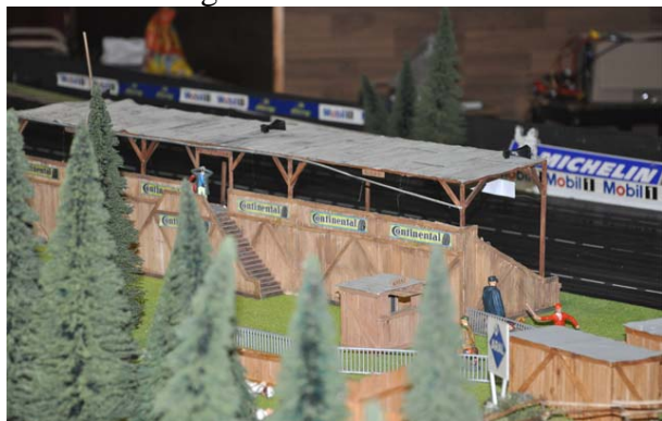
Noch sind die Tribünen in Duisburg verwaist . .

Bitte berücksichtigt die o.a. Durchmesser bei der Einstellung der Bodenfreiheit . . . !!