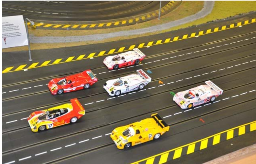
Die schnellste Startgruppe anno 2010 . . .

Die anderen Gäste sollten aber sicherheits halber das ein oder andere Zehntel für die individuelle Schallmauer hinzu addieren . . . !☺“