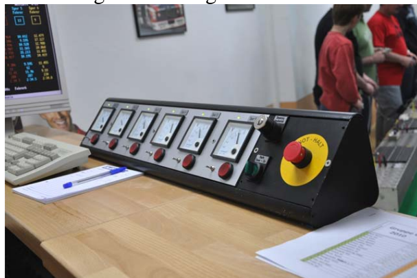
Die Heaven Schaltzentrale . . .

Diesen Part haben wir bereits in der letzten WWW angemessen abgehandelt . . .