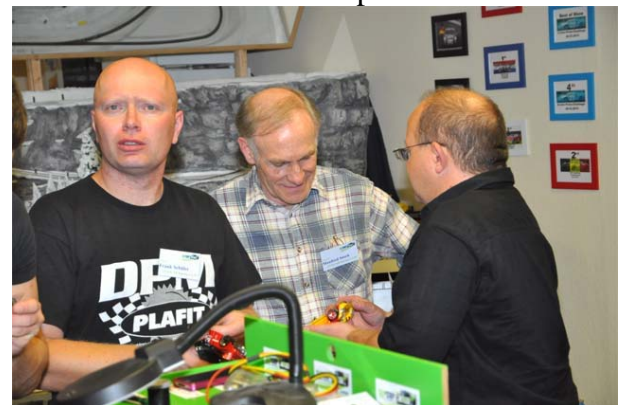
Echte „Newbees“ beim SLP-Cup Meeting !©

Mehr zu diesem Programm weist ein separates Dokument auf der SLP-Cup West Seite aus!