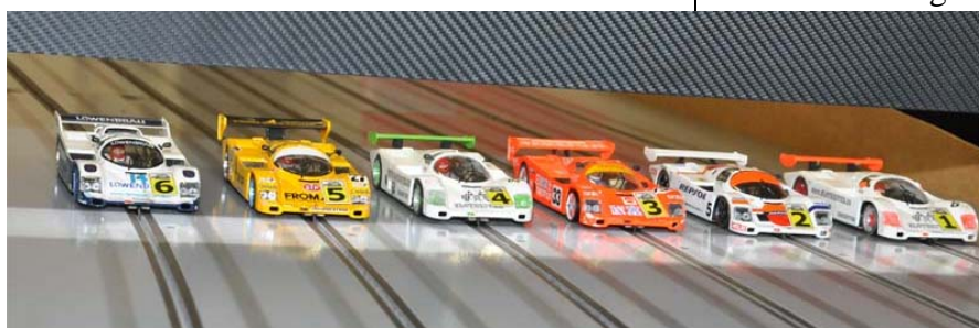
. . . und auf Holz