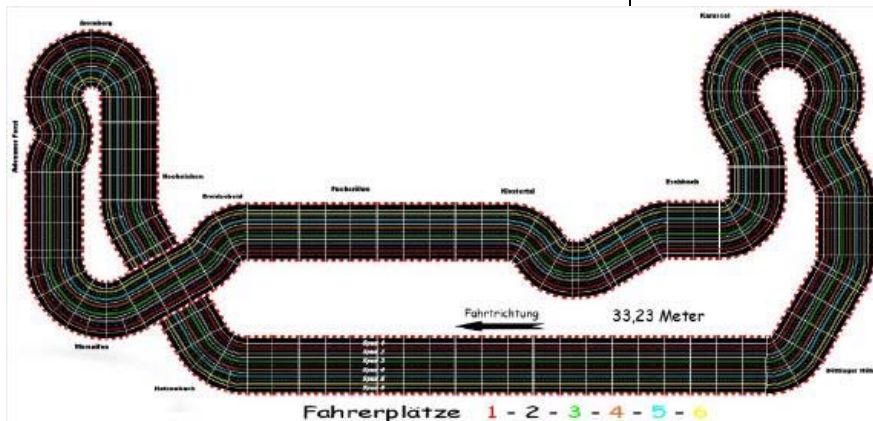
Die 33,2m Slotcar Heaven im Luftbild . . .

Bezüglich der passenden Übersetzung bleibt's bei der altbekannten Empfehlung: Ca. 27,5mm Wegstrecke pro Motorumdrehung – wie üblich +/- ein Zahn auf der Achse . . .