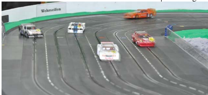
Die schnellsten Gr.5 Jungs anno 2010 in der ersten Runde . . .