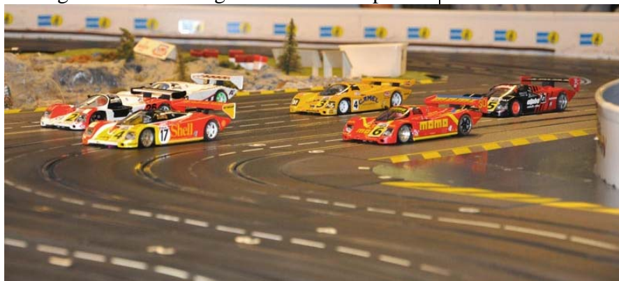
SLP-Cup auf Plastik . . .

der gewirbelt. Ferner hat's nun einen eigenständigen Strafenkatalog für den SLP-Cup . . .