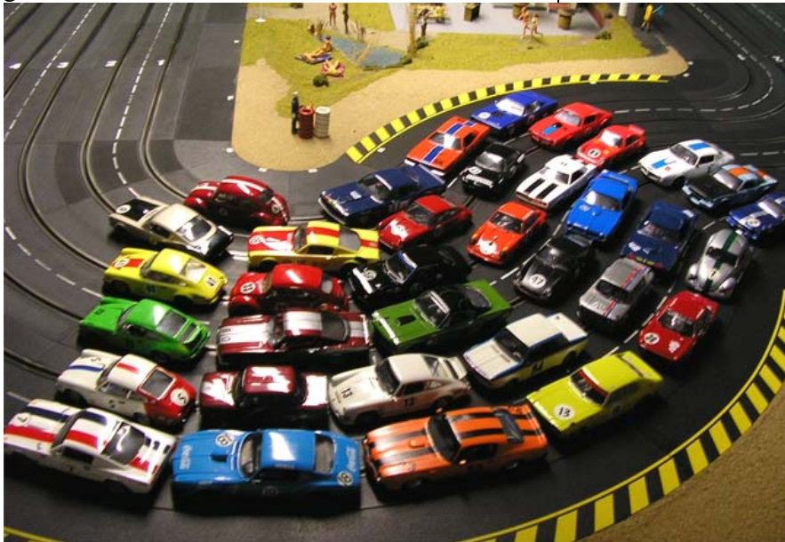
Das Starterfeld beim Finale 2010 ...

Um 12:00 Uhr wird es dann ernst: Die erste Startgruppe der Klasse 1 wird auf die Reise geschickt!