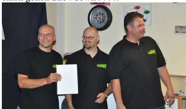
„ZuSpätBremsen“ weisen die beste Ausgangsposition für den Gewinn des Teampokals auf!

Viel Interessanter wird's beim Teampokal : Hier haben „ZuSpätBremsen“ (ZSB) die beste Ausgangsposition. Einzige ernsthafte Konkurrenz sind die Jungs von „LRD International“ (LRD). Wobei diese schon tunlich zwei Ränge vor ZSB durch's Ziel kommen sollten. Und hier könnten die Heimascaris vom Team „Schwerte“ ins Spiel kommen !?☺ Aber Grau ist alle Theorie – freuen wir uns einfach auf einen geilen Showdown . . . !!