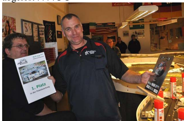
Der Siegertyp aus 2010 würde den Pokal wohl am liebsten an einen Teamkollegen von „LRD International“ weiter geben . . . !☺