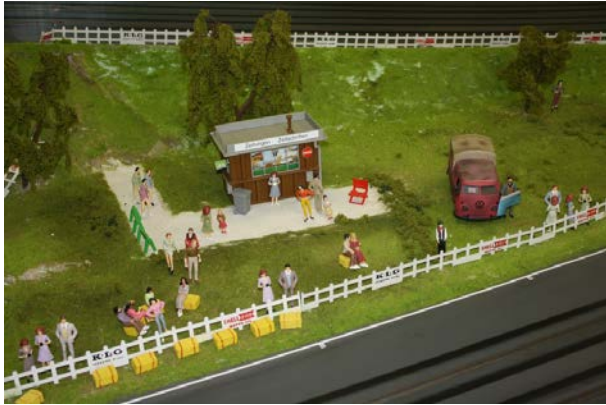
Bahngestaltung à la 1zu24slot!!