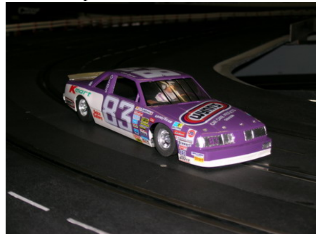
Ein Oldsmobile Delta 88 von 1988

nen harmonischen Verlauf der vielen engen Radian versprechen.