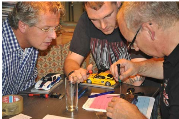
Äußerste Konzentration an der Ruhr !☺☺

können die 245 Fahrzeuge ohne Probleme mitrollen - lediglich die Grip Bedingungen werden sich am Renntag geringfügig ändern!☺ Denn wie üblich steht am 22.6. selbstredend ein gründliches Bahnputzen auf der Tagesordnung . . .