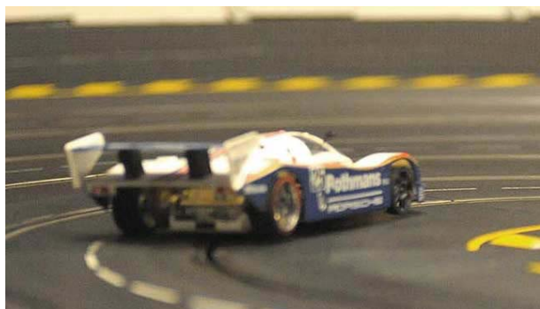
Stunts in der Tunnelleinfahrt: Obligatorisch!