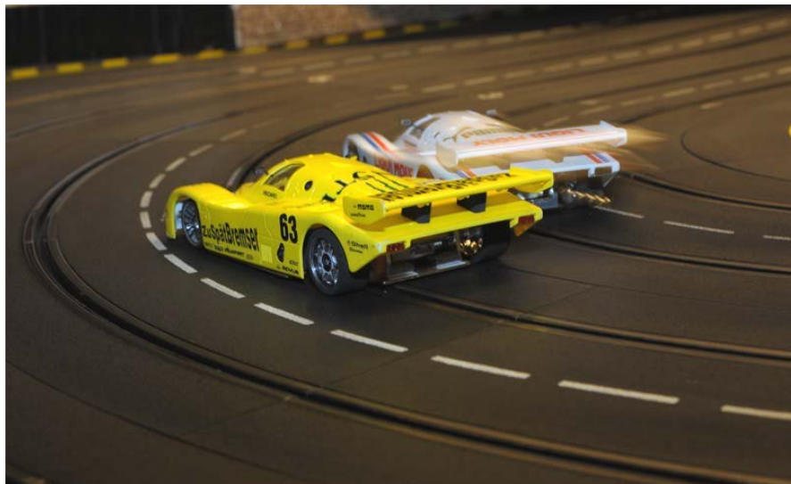
Das Titelduell anno 2011 . . .

herum. Dort ist der 30m-Plastikrundkurs so etwa 500 Mal zu umrunden, bevor die Rangfolge für die laufende Saison endgültig feststeht . . .