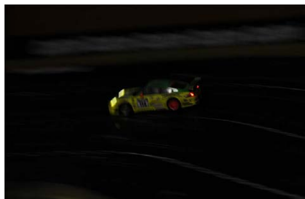
Anschließend am Abend die am Testtag obligatorische „Nachtsession“ ...