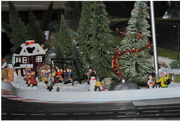
Temporäre Winterlandschaft in Duisburg ...