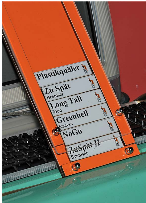
.. sowie Jörg Mews – u.a. für die Umsetzung der o.a. „Trainingstafel“ ...