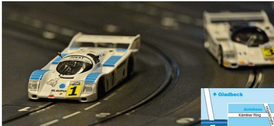
Cup2Night – ausgetragen mit den überaus soliden SLP-Cup Porsche 962 ...

Von der Sackgasse aus führt ein Weg neben den Häusern über den Hof zum Hauseingang. Ist gar nicht so kompliziert, wie es sich anhört.“ (Zitat von der Webseite Slot im Pott)