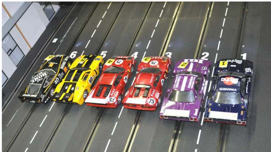
Die schnellste Startgruppe 2011 beim letzten Teamrennen mit den Gr.5 (im ScaRaDo) – die beiden „Pizzateller“ von S 2 auf Doppelpole . . .

fürten Gepäckstücke auf ein Mindestmaß zu beschränken ist – wir verfügen nur über begrenzten Platz und rechnen mit knapp 40 Teilnehmern . . . !!