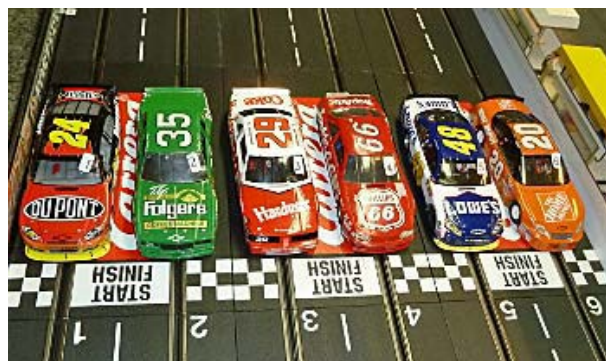
1. Gruppe Heat 2

Pia steigerte sich zwar und blieb vor Grischa, aber gesamt reichte es nicht. Die Plätze 15 bis 21 wurden genau bezogen wie vorher, davor