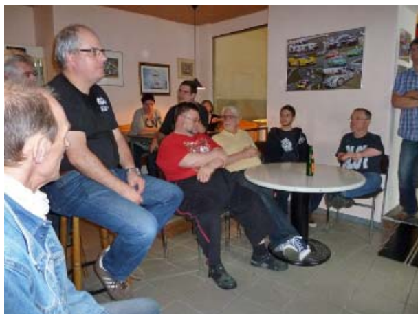
Warten auf die Siegerehrung