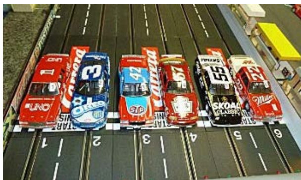
3. Gruppe Heat 1