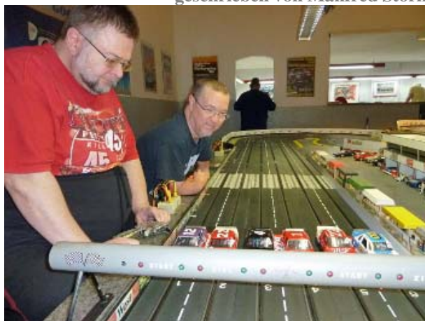
Zwei Buben bestaunen die Rennautos am Start

Nach einer längeren Sommerpause fand in Schwerte der 5. Wertungslauf zum NASCAR Winston Cup statt. Einige waren heiß darauf, ihre Boliden wieder in den Kampf um Meisterschaftspunkte einsetzen zu können.