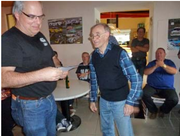
Position 6 behauptet von Poldi