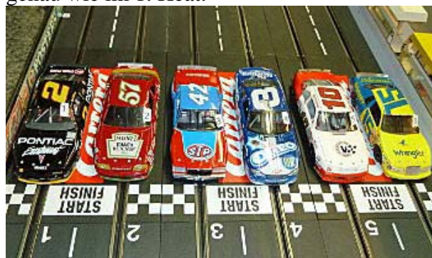
2. Gruppe Heat 2

Nach der Neugruppierung für den zweiten Durchgang waren wieder spannende Positionskämpfe zu beobachten. Aber erstaunlicherweise blieben die Platzierungen durchweg genau wie im 1. Heat.