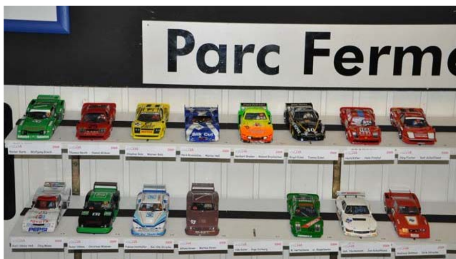
Anno 2009 – 18 Cars im Tal der Wupper . . .

70cm (!! ) Steigung - gefahren wird im Sitzen - Ausgangswert für eigene Getriebetests sind 29mm Wegstrecke pro Motorumdrehung . . .