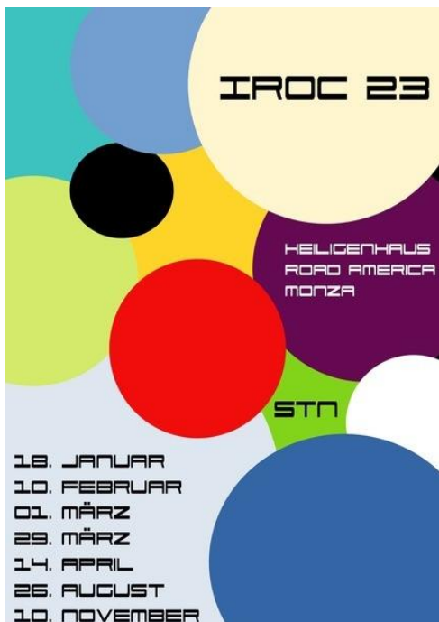
Das IROC Rennplakat für die Saison 2023