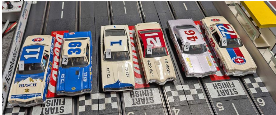
Zweite Startgruppe in Heat 1

zum ersten Mal im Einsatz. Überraschend war, dass er am Ende in diesem Heat bis auf P9 zurückgefallen war.