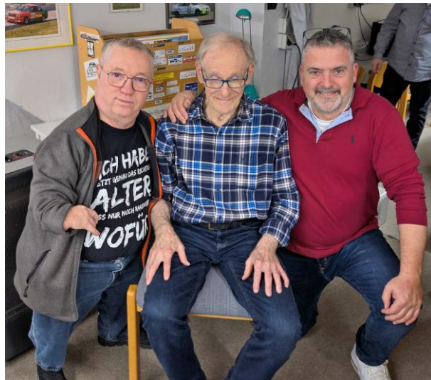
Die ersten Drei der Grand National Meisterschaft 2025 – Glückwunsch!!

Der Autor konnte sich noch durch einen besseren zweiten Durchgang auf die P4 gesamt verbessern und sich so den Meistertitel sichern.