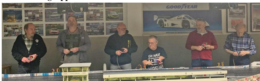
...die Fahrer dazu