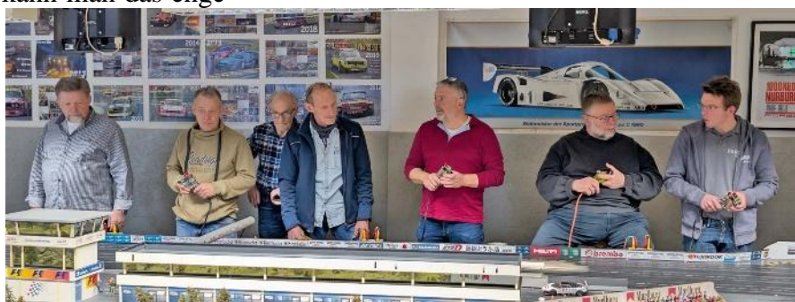
...die Fahrer dazu