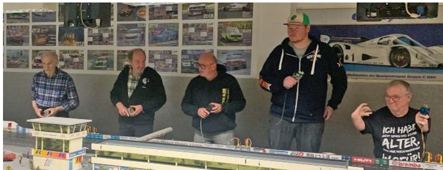
Fahrer der zweiten Startgruppe in Heat 2

Anhand der Rundenzahlen kann man das enge Geschehen gut beschreiben: