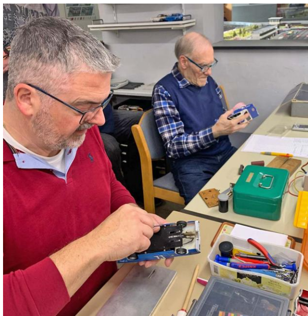
Fahrzeugabnahme – konzentriert bei der Sache!