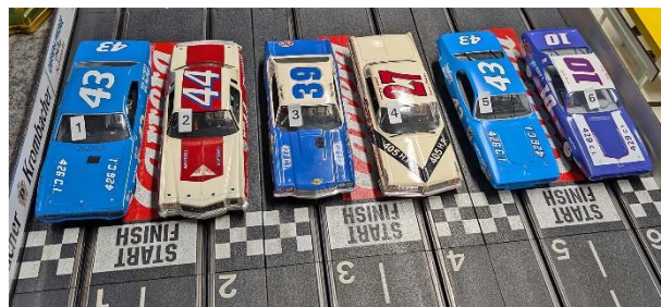
Erste Startgruppe in Heat 2