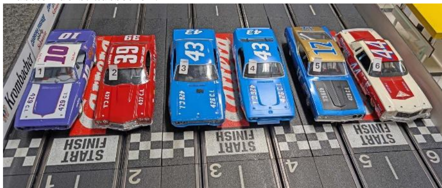
Erste Startgruppe in Heat 1