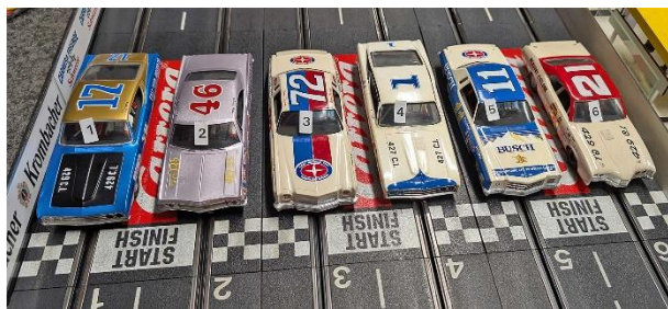
Zweite Startgruppe in Heat 2