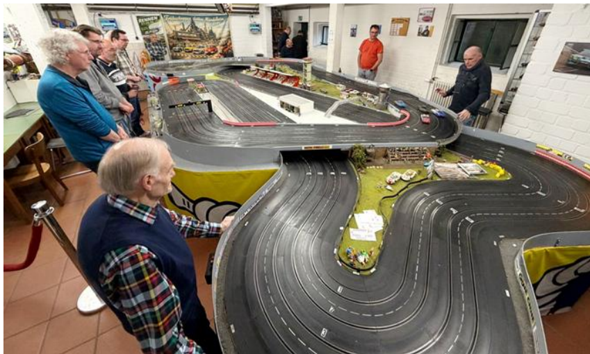
Slottrack Übersicht in Mündelheim kurz nach dem Start einer Gruppe