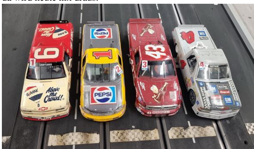
Startgruppe 1 - mit Manni, „PUdriver“, „Kasi-slot“ und Ersatzracer Volker