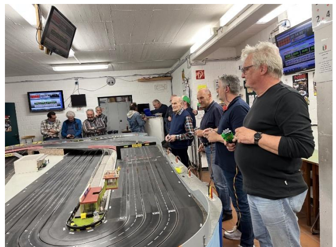
Durch straffe Zeitregie war es noch vor 22 Uhr, als die letzte Gruppe startete!

Auch hier werden wir versuchen den Kontakt aufzunehmen, um noch paar Bausätze verfügbar zu machen.