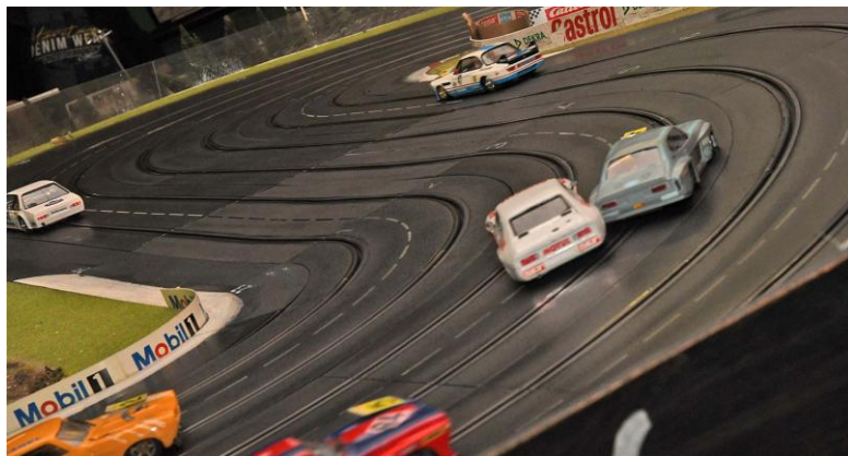
Zweite Kurve – die Capris hinken erst einmal hinterher...