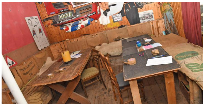
„Herzkasper“ beim Autor – wenn beide technische Abnahmen im laufenden Betrieb verwaist sind, geht’s mal wieder nicht voran...