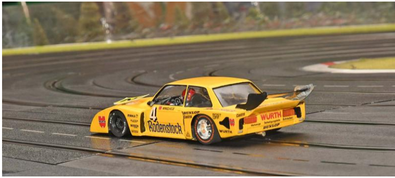
Ende – diese Variante des BMW 320 Aeroheck ist m.W. nie in einem DRM-Rennen gestartet; in der 245 schon...