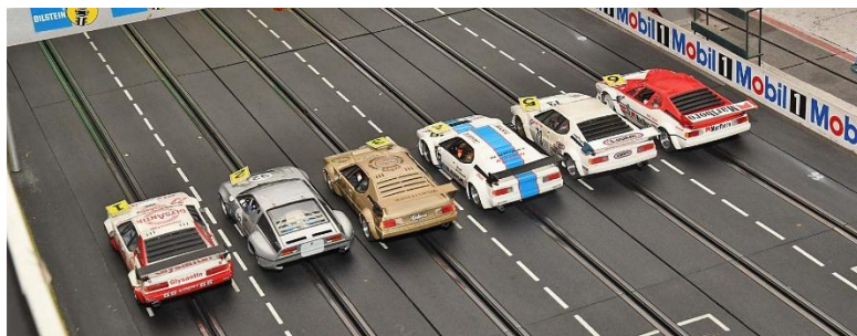
Die dritte Startgruppe – ein schöner Rücken, kann auch...