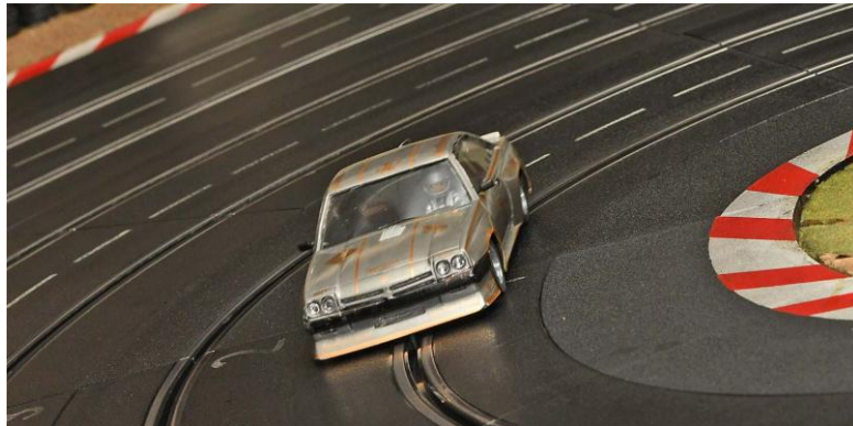
Antonia beamte den Manta GT/E in die Top 10...