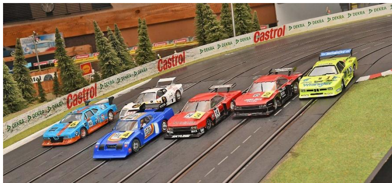
Erste Gruppe – die zwei „Pizzateller“ seehr ähnlich...