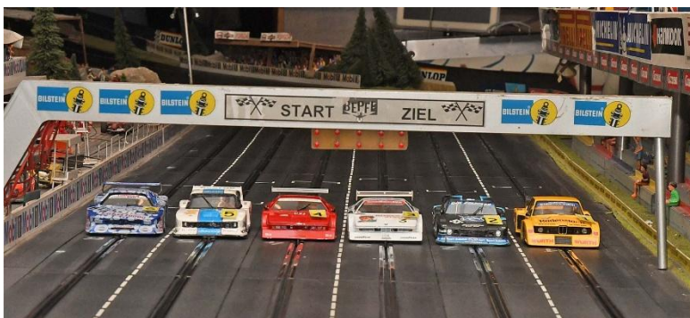
Dritte Gruppe: Die Top 6 des Vorjahres – links auf der Sechs der schnellste Silhouetten-Pilot 2025...