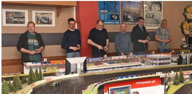
Die Fahrer – jedoch schon auf der fünften Spur...