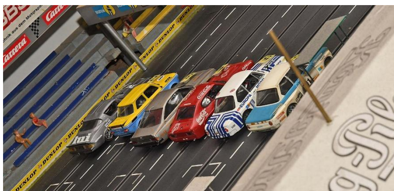
Dritte Startgruppe – von links nach rechts die Plätze 4, 3 und 2 des Teamrennens in Emsdetten...