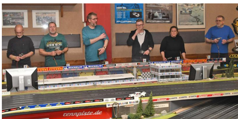
Konzentrationsschwäche – für die Startgruppe #2 fehlt das Foto von den Cars und aus der ersten Runde! Hier zumindest die Fahrer*Innen-Besetzung im Bild...