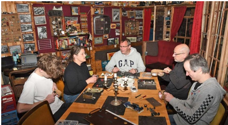
Besagte Materialausgabe – hier die „Bremsersgruppe“...