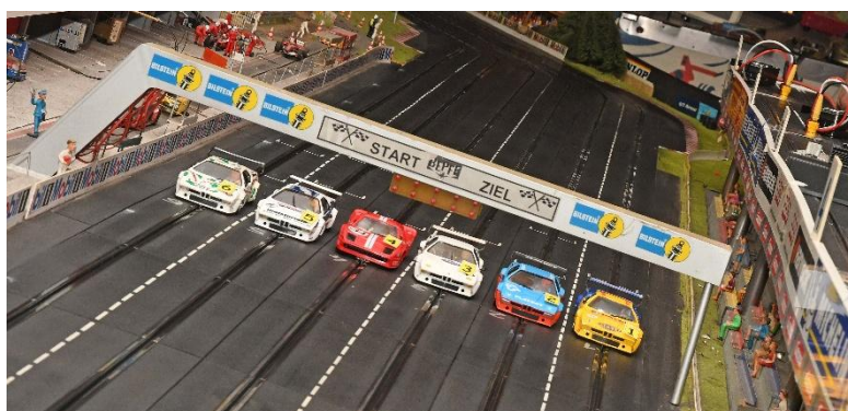
Zweite Gruppe – erneut fast nur BMW M1 Procar...