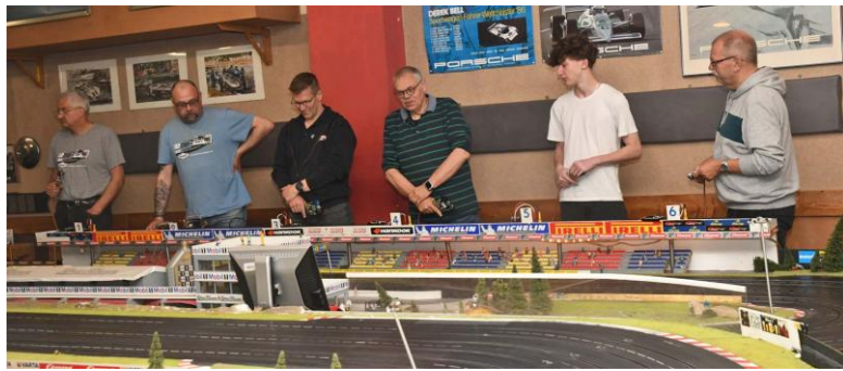
Die Fahrer dazu...