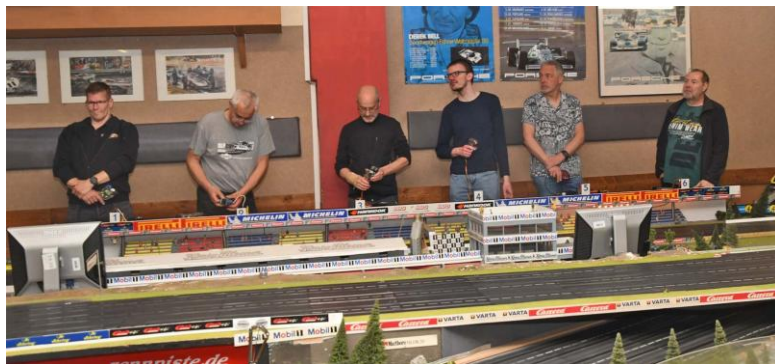
Nix „Krabelgruppe“ (Text links aus dem Vorjahr!) – die GT-Ränge 2, 3 sowie 6-8 werden hier ausgefahren!!