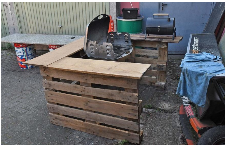
Mal soeben Freitagnacht in ein paar Minuten gebaut – Grillstation á la Don Pasquale...