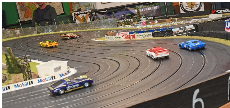
Zweite Kurve – alle gut losgekommen; MartinB liegt mit dem „Warsteiner“-M1 erst einmal vorn...