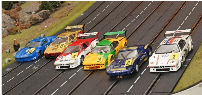
Erste Startgruppe: Zwei Italos plus vier BMW M1 Procar – und ein weiterer Jota sollte noch dazustoßen...