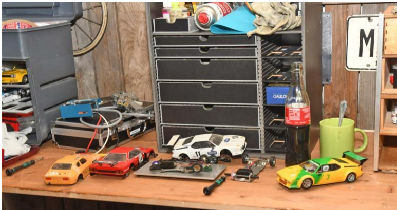
„Ready to rumble!“ – s’schaut zwar leicht chaotisch aus, aber Hannes ist klar für die Materialausgabe...