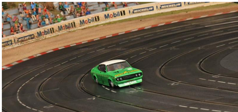
„Grün“ zu oft im Grün – „Has’se doch letztes Jahr schon ge- sagt!“ musste sich der Autor anhören...