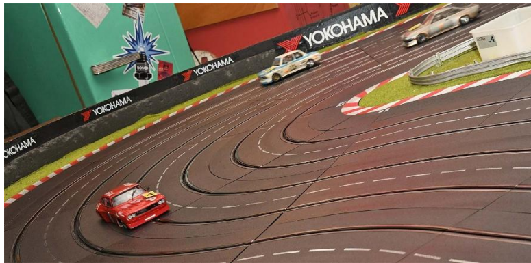
Vierte Kurve – nicht alle schafften die Erste...