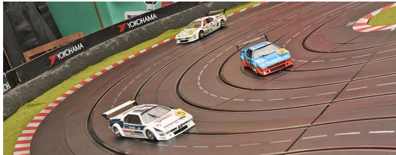
Vierte Kurve – sagen wir mal, HansP ist schon durch und das sind die Verfolger...