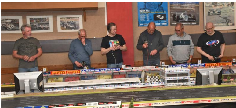
Die Fahrer – Spur 6 ist rechts...