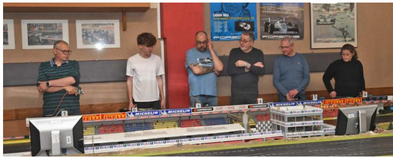
Nur zwei dieser Folks schafften's in die Top 10...