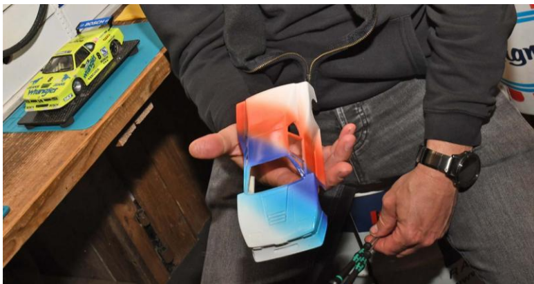
Neues gab’s nicht viel, aber immerhin ein Neubauprojekt!