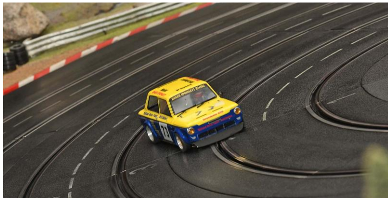
Der Hillman Imp performte „really great“ – leider hatten die herumliegenden Kolleg*Innen ‘was gegen einen Imp-Sieg...