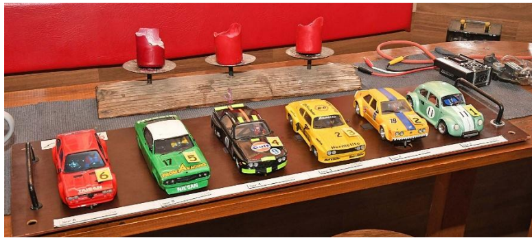
Erste Startgruppe – die Ober-Burner auf den zwei Außen- spuren (Alfasud links / Käfer rechts)...