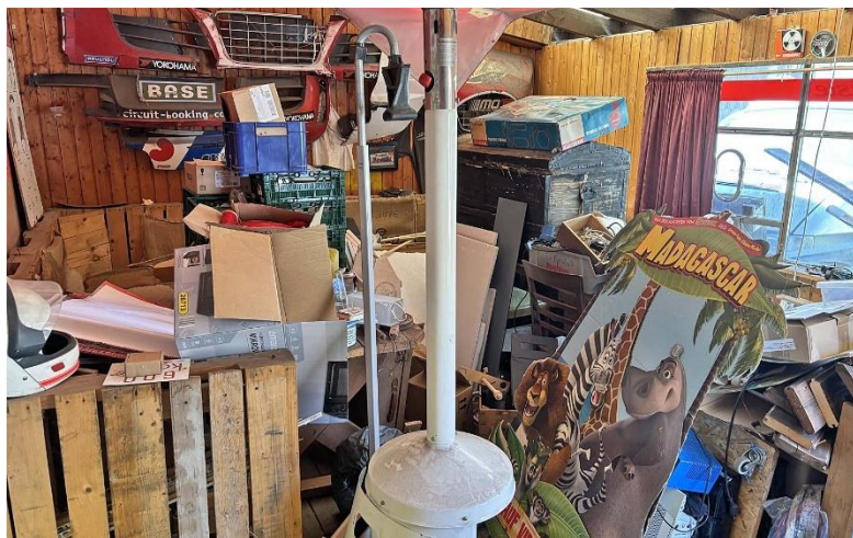
Vorher / nachher – dasselbe Environment eine Woche zuvor; Pascal ist an am Aufräumen!

Auf zum „Racing“: 20 Volt auf 6*3 Minuten Fahrzeit in jeweils drei Startgruppen – Gruppe 2 zuerst.