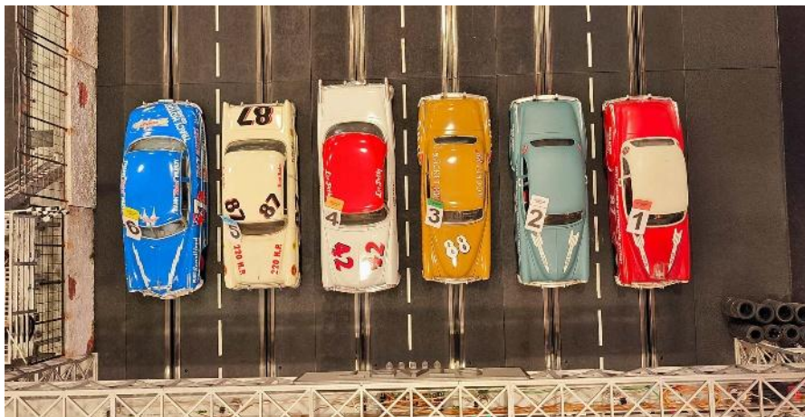
Die erste Startgruppe