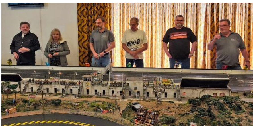
Die Fahrer und Fahrerinnen dazu