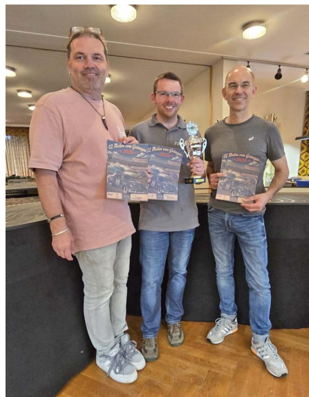
Die Sieger des Tages: Herzlicher Glückwunsch!