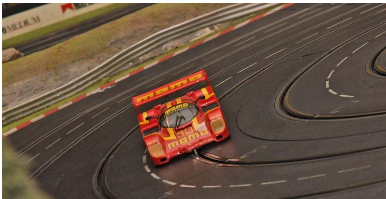
Nach dem ersten Drittel war bei „RheinRuhr“ ein intensives Briefing angesagt – das half sehr!!