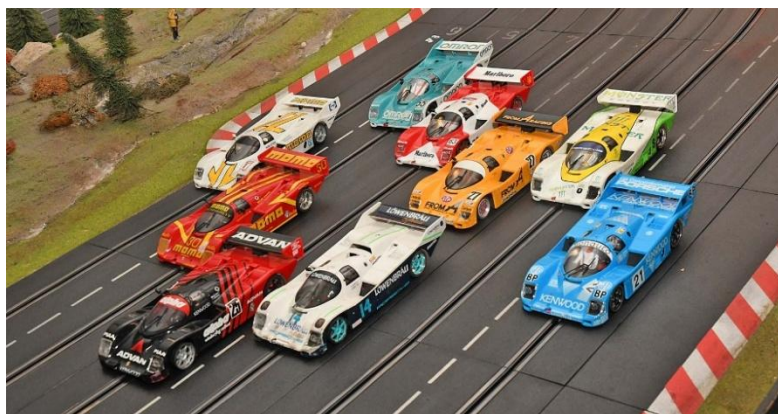
Die Top 9 von Duisburg – kein einziger „Coke!!!“

Mit dem letzten Relais-Klacken gegen 19:00 Uhr ging die Hitzeschlacht von Duisburg zu Ende. Niemand ist aus den Latschen gekippt – das Racing war ein Knaller. Der Autor ist echt stolz auf diese Truppe!