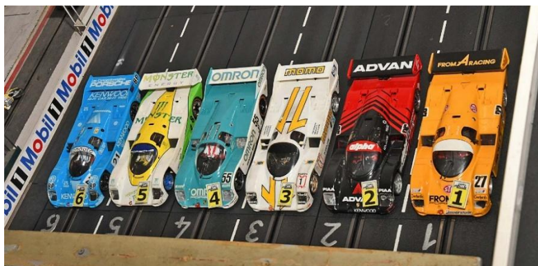
Die ausgelosten ersten Sechs vor dem Start – zumindest keine Dopplungen beim Design...