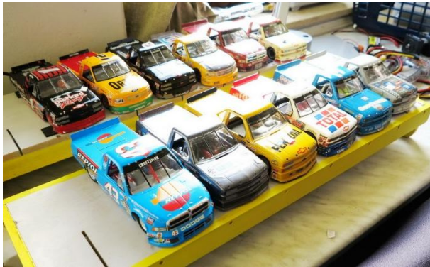
Und so füllten sich die Startgruppen...