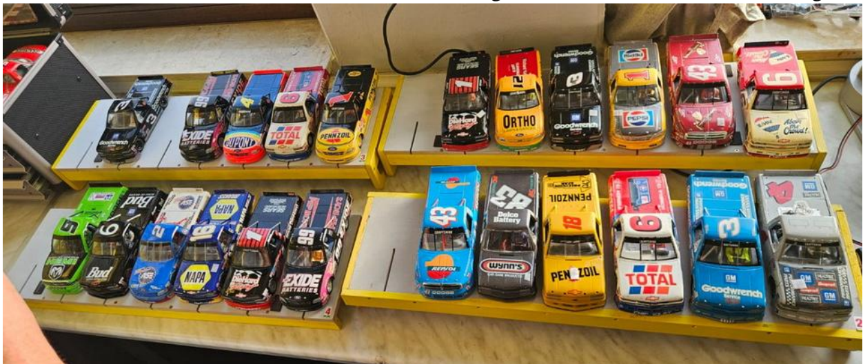
Noch ein paar Trucks und wir können starten...