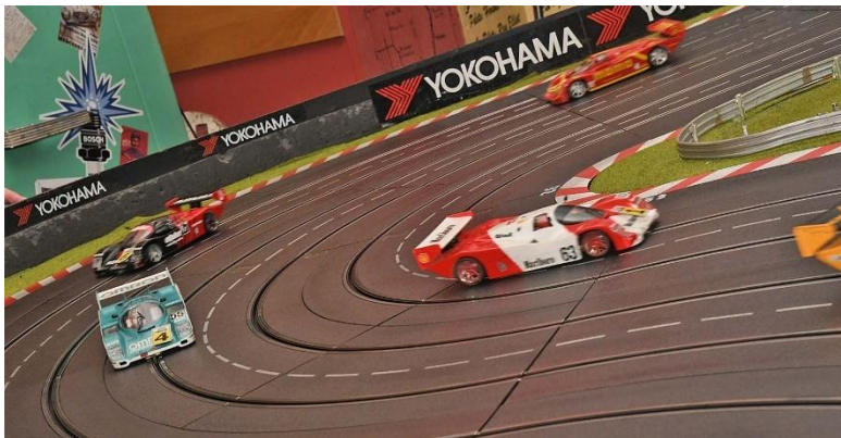
Erste Runde, Turn 4.5 - „Gentlemen“ ist durch (rechts am Rand); „Ruhrpötter“ und „R2“ als Verfolger – wo ist „ZuSpät“ !?