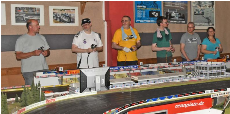
Die Start-Fahrer*Innen – Spur 1 ist links...