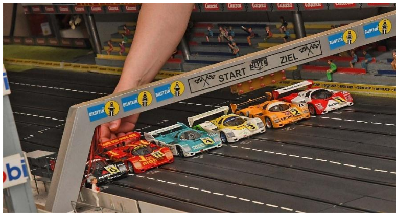
Erneutes Regrouping – „Gentlemen“ und „ZuSpät“ haben getauscht; der Rest ist (noch) irdentisch...