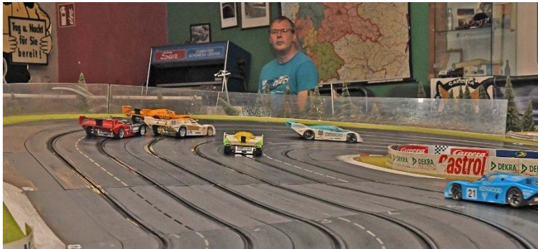
Dritte Kurve – „R2“ an der Spitze; „Nr.9“ (rechts) hält sich vornehm zurück...