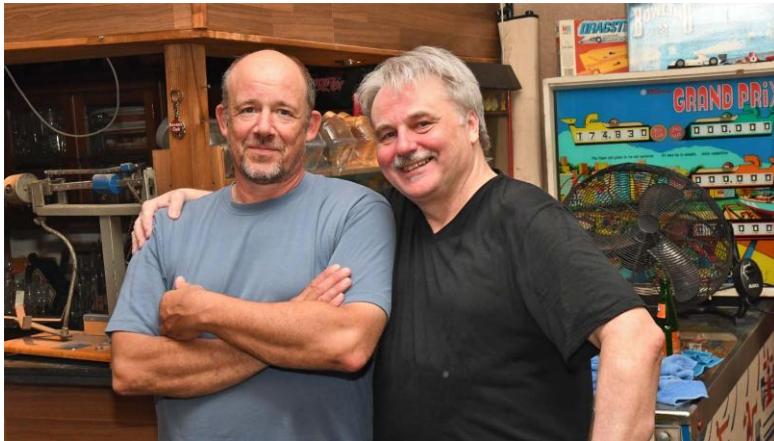
Dieses Foto muss, auch wenn's eine Wiederholung vom Vorjahr ist – endlich einmal ein Henni, der nicht ganz so traurig dreinschaut, wenn er gewonnen hat!!