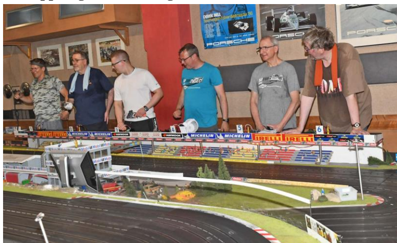
Die Fahrer (aufgenommen erst) vor der letzten Spur – Spur 1 ist links...

Und erstens kommt es anders – und zweitens als er denkt!