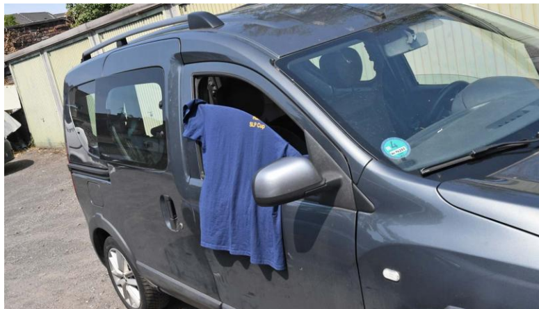
Derweil trocknet Hans eines seiner zahlreichen T-Shirts an Dons Car – mutmaßlich hatte er am WE deren Sechs im Einsatz...