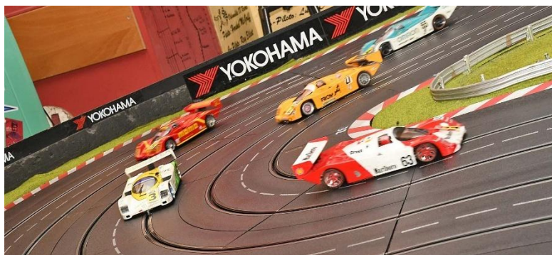
Erste Runde – „Ruhrpötter“ halten sich nicht mehr zurück; dahinter sehen wir schon die Fights um P2 und P4...