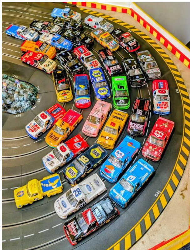
Die Parade zum Rennabend