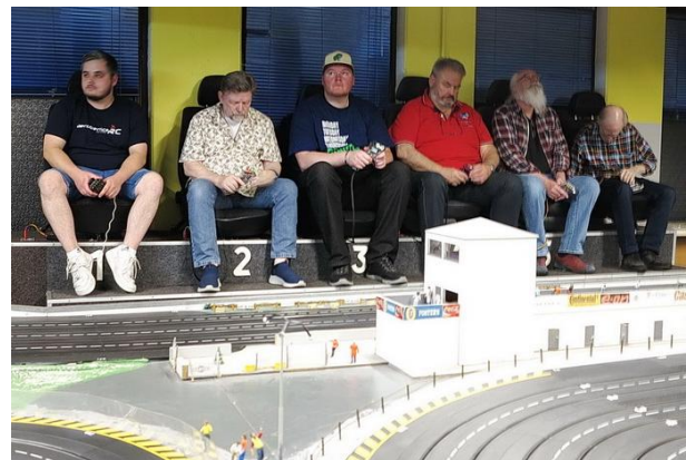
Die Startgruppe 1 mit den schnellen Jungs...