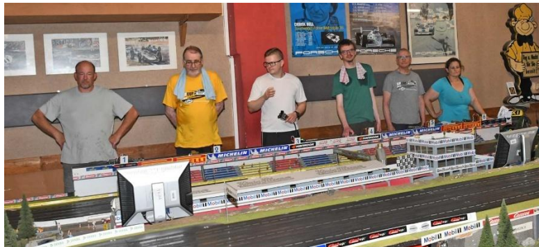
Damit ist zumindest ein Startfahrer (bei „ZuSpät“) ein anderer...