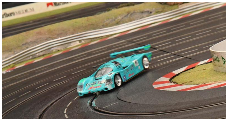
Gab's auch noch nicht – der „Leyton House“ von „Ruhrtal“ wurde bei der technischen Abnahme wg. Defekt aussortiert und durch den „Löwenbräu“ ersetzt; dieser schaffte das Rennen dann problemlos...