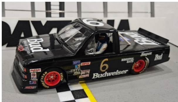
Und neue Fahrzeuge gab es auch – hier von Jan