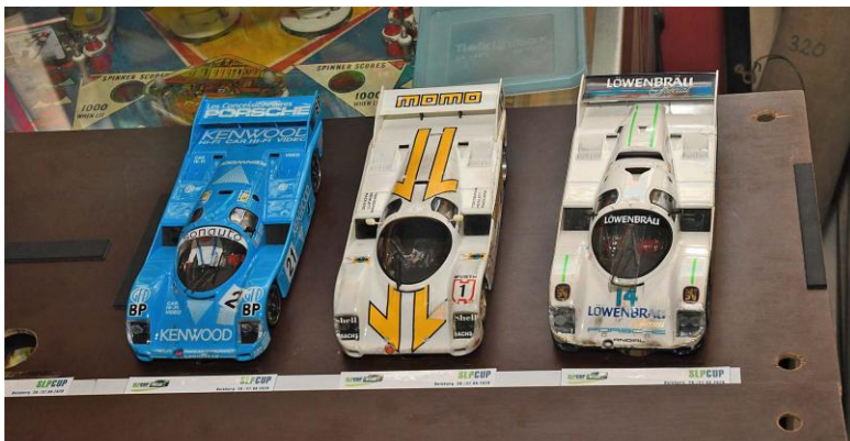
Ab dem Mitteldrittel künftig nicht mehr im Start-Bild – diese drei Cars... „Nr.9“ (P8, Links) – „NoGrip“ (P9, Mitte) – „Ruhrtal“ (P7, Rechts)