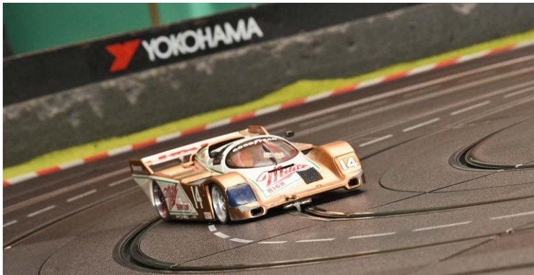
Kein Foto vom führenden „Marlboro“; der lässt sich sehr schlecht gratofieren; aber ein „Henni“ als Ausgleich...