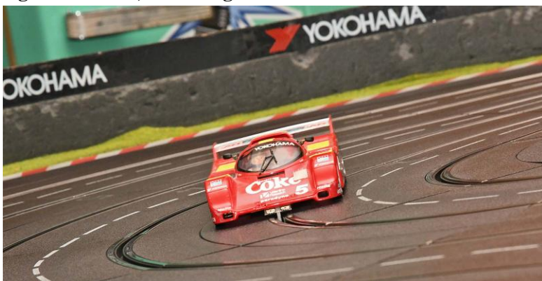
Zumindest ein „Coke“-Foto muss – hier das „R2“-Gefährt im Training...