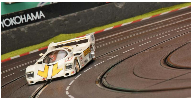
„NoGrip“ mussten mit wenig Bahnerfahrung erst einmal in Tritt kommen – die nächsten Drittel wurden dann besser!!