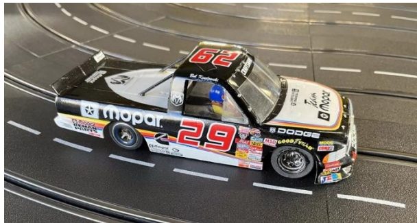
Wie immer selten zu sehen – der Dodge im Mopar-Trimmm...