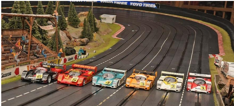
Regroupt – Startaufstellung nun nach Rennergebnis (Spur 1 ist rechts)...